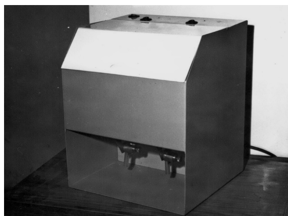
Рис. 2. Аппарат для выделения личинок трихинелл

Конструкция блока выполнена в виде функциональных модульных плат.